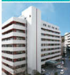
丸木記念福祉メディカルセンター