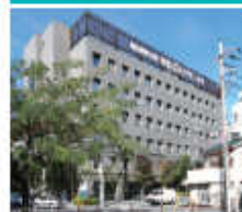
かわごえクリニック